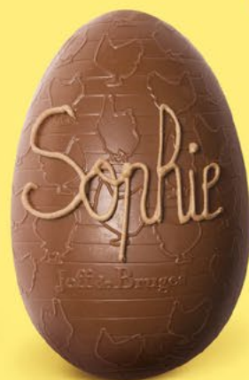
Chocolat au lait