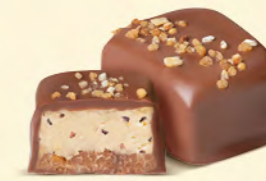
Duo gianduja noisettes et crème au beurre avec éclats de fèves de cacao et de noisettes