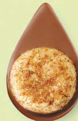
BISCUIT NOISETTES Chocolat au lait 35% de cacao

Un biscuit sablé artisanal posé sur un très bon chocolat ! C'est simple et c'est divin.