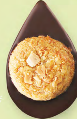
BISCUIT AMANDES Chocolat noir 60% de cacao