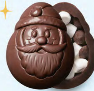
CHOCOLAT NOIR Guimave et pépites de chocolat