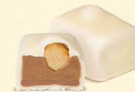
Duo praliné noisettes et crème au beurre au café, avec sa noisette caramélisée