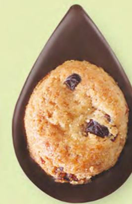
BISCUIT CRANBERRIES Chocolat noir 60% de cacao