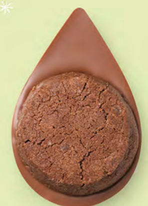
BISCUIT BROWNIE Chocolat au lait 35% de cacao