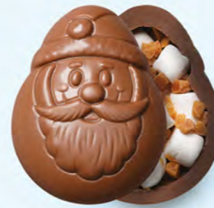
CHOCOLAT AU LAIT Guimave et éclats de caramel